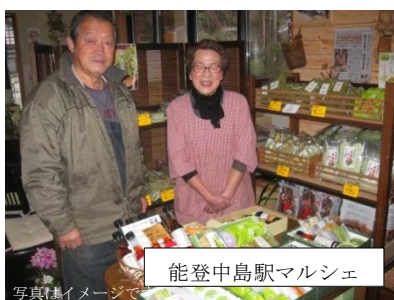
能登中島駅マルシェ

昭和61年に郵便の鉄道郵送が廃止され、鉄道郵便車は2両のみ現存しており（うち1両は東京の郵政大学校に保存）、その車内は当時の様子が再現されています。